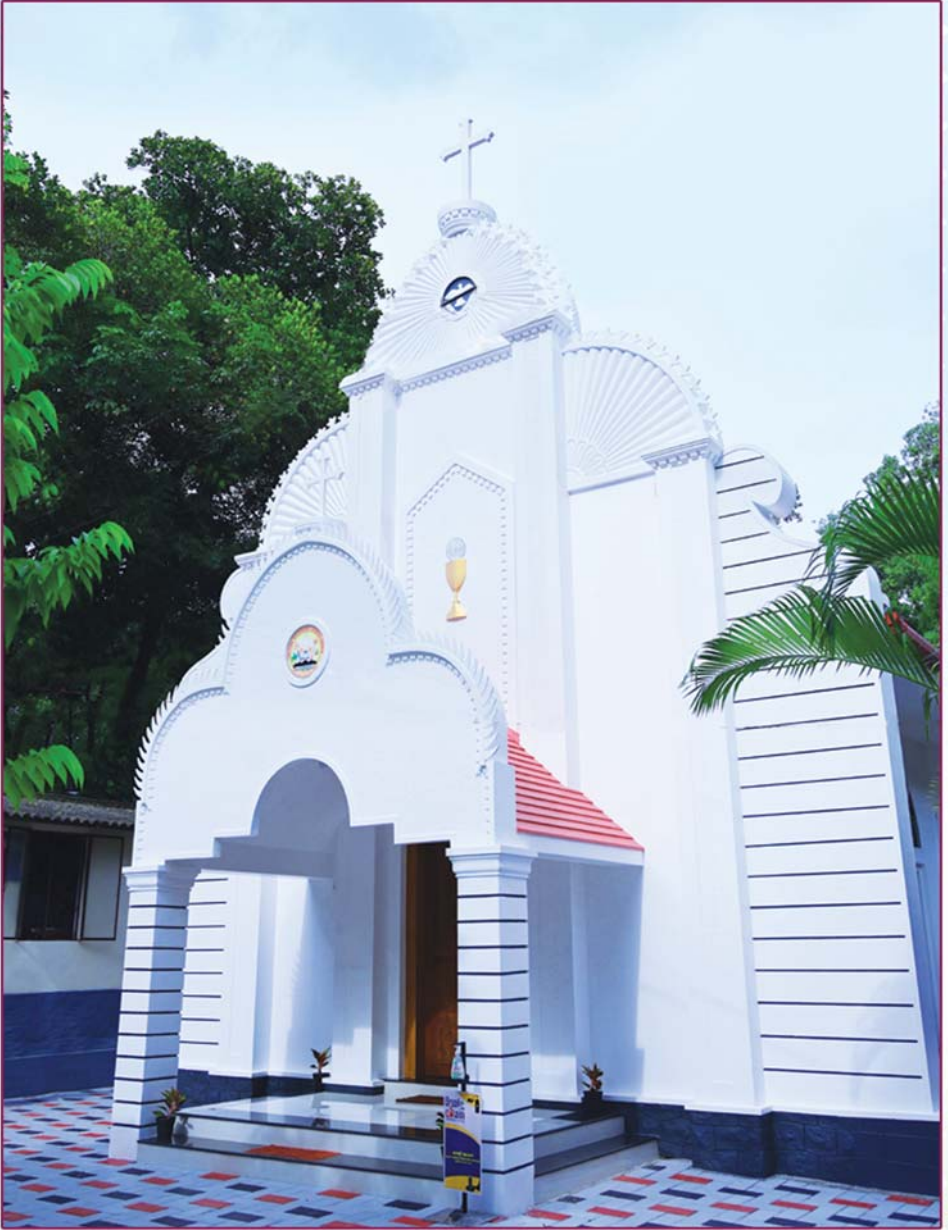
അത്യഭിവന്ദ്യ കാതോലിക്കാബാവா തിരുമേനി കുമാര ചെയ്ത സെന്റ് തോമസ് മലങ്കര സുറിയാനി കത്തോലിക്കാ ദൈവാലയം, ഉരൂരകം (15 ആഗസ്റ്റ് 2020)