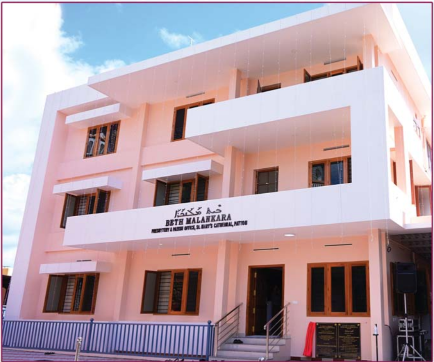
അത്യദിവന്ദ്യ കാതോലിക്കാബാവാ തിരുമേനി കുദാശ ചെയ്ത 'ബേത്ത് മലങ്കര'- സെന്റ് മേരീസ് കത്തീഡ്രൽ പ്രെസ്ബിറ്ററി. (23 ഓഗസ്റ്റ് 2020, പട്ടം)