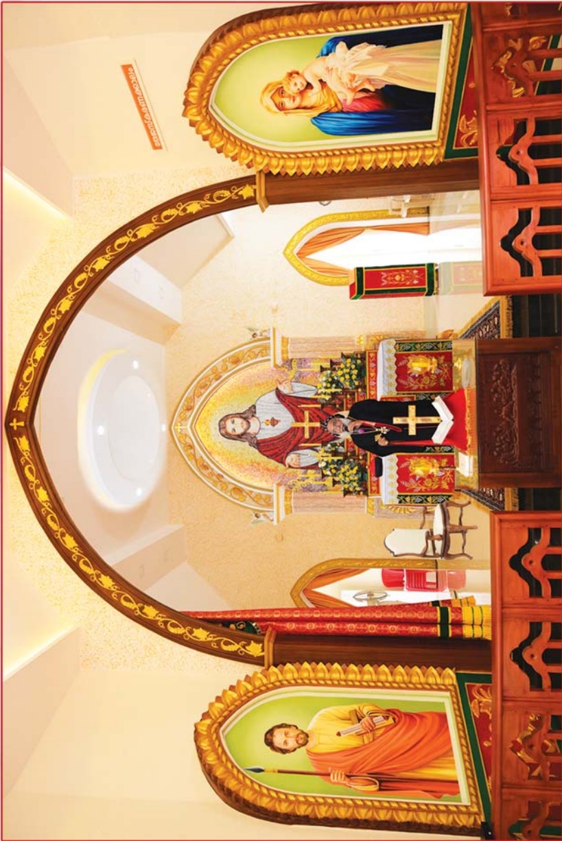
ഊരകം സെന്റ് തോമസ് മലങ്കര സുറിയാനി കത്തോലിക്കാ ദൈവാലയം അത്യഭിവൃദ്ധി കാതോലിക്കാബവാ തിരുമേനി കുറ്റാര മെയ്ത് സന്ദേശം നൽകുന്നു. (15 ആഗസ്റ്റ് 2020, ഊരകം)