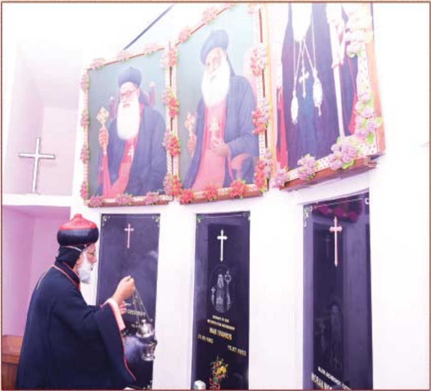
അത്യഭിവന്ദ്യ കാതോലിക്കാബവാ തിരുമേനി കബറുകൾ ധൂപം അർപ്പിക്കുന്നു. (14 ജൂലൈ 2020, പട്ടം കത്തീഡ്രൽ)