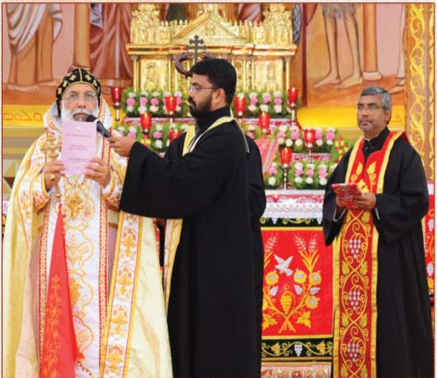
തിരുവനന്തപുരം മേജർ അതിഭദ്രാസനത്തിന്റെ ഭരണ നിബന്ധനകൾ (SMAT) അത്യഭിവന്ദ്യ കാതോലിക്കാബാവാ തിരുമേനി വിളംബരം ചെയ്യുന്നു. (15 ജൂലൈ 2020, പട്ടം കത്തീഡ്രൽ)