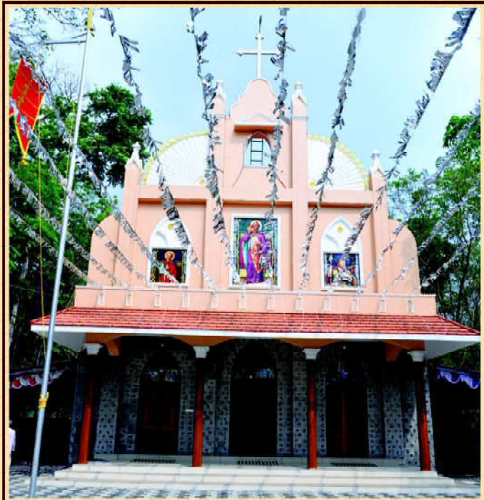
അത്യഭിവന്ദ്യ കാതോലിക്കാബവാ തിരുമേനി കുറാശ ചെയ്ത നടക്കുന്നത് ദൈവാലയം (9 ഫെബ്രുവരി 2019)