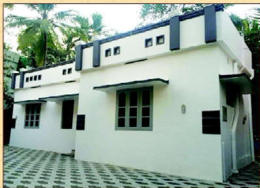
അത്യദിവന്ദ്യ കാതോലിക്കാബവാ തിരുമേനി കുറ്റാരം ചെയ്ത വൈദിക മന്ദിരം (മൂന്നാംമുക്ക്, 9 ഫെബ്രുവരി 2019)