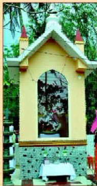
അത്യദിവന്ദ്യ കാതോലിക്കാബവാ തിരുമേനി കുറ്റാരം ചെയ്ത മാർ തീവർത്തിസ് സഹദാ കുരിശ്ശി (നടുക്കുന്ന്, 9 ഫെബ്രുവരി 2019)