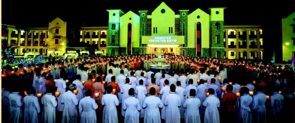
പുൽവാമാ ദീകരാക്രമണത്തിൽ രക്തസാക്ഷികളായ ധീരദേവന്മാരുടെ ആദരാഞ്ജലികൾ (മലങ്കര വൈദിക സംഗമം, ഗിരിദീപം കൺവെൻഷൻ സെന്റർ, 18 ഫെബ്രുവരി 2019)