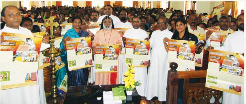
കാരിത്താസ് ഇന്ത്യ നടപ്പിലാക്കുന്ന സംസ്ഥാനതല 'ലൈന്റേൻ ക്യാമ്പൈൻ' എം. എസ്. എസ്. എസ്സിന്റെ ആദിമുഖ്യത്തിൽ ആയൂരിൽ വച്ച് അത്യദിവന്ദ്യകാതോലിക്കാബാവാ തിരുമേനി ഉദ്ഘാടനം ചെയ്യുന്നു. (21-02-2020, ആയൂർ)