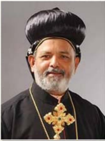
അഭിവന്ദ്യ ജോഷ്യാ മാർ ഇസ്രായീൽ തിരുവനന്തപുരം (ഒന്നാം വൈസ് പ്രസിഡന്റ്)