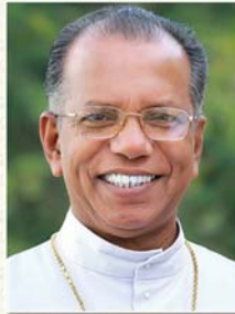
അഭിവന്ദ്യ മാർ ജോർജ്ജ് സെന്റ് ജോർജ്ജ് തിരുവനന്തപുരം (രണ്ടാം വൈസ് പ്രസിഡന്റ്)