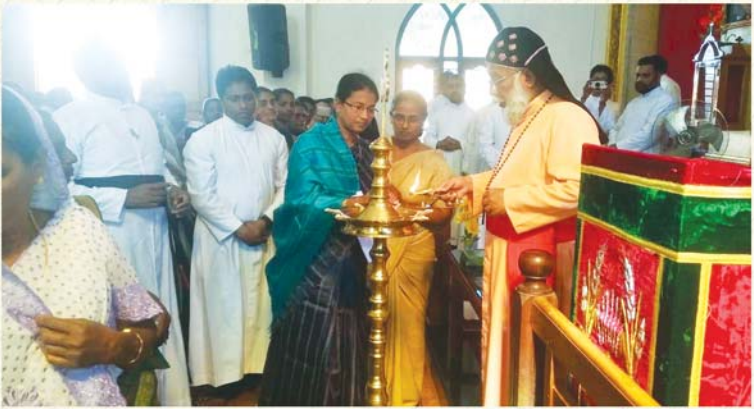
മാതൃസംഘം മേജർ അതിഭദ്രാസന സംഗമം അത്യദിവന്ദ്യ കാതോലിക്കാബാവാ തിരുമേനി ഉദ്ഘാടനം ചെയ്യുന്നു. (21-02-2020, ആയൂർ)