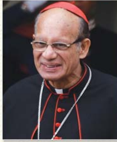
അത്യുന്നത കർദ്ദിനാൾ സെർവാശ്വസ് ശ്രേഷ്ഠൻ തിരുവനന്തപുരം (പ്രസിഡന്റ്)