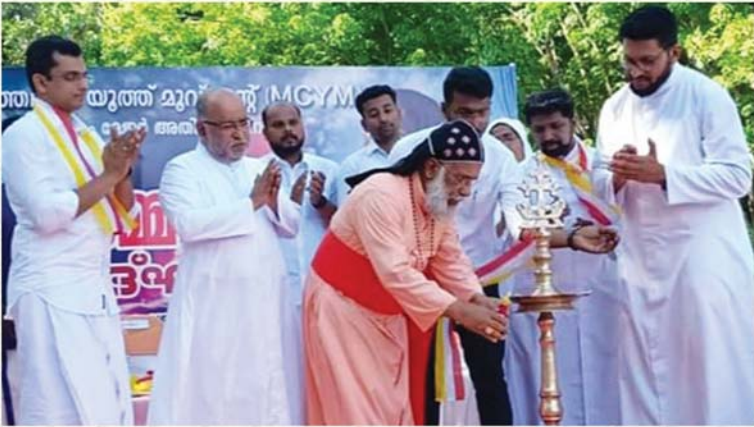
എം. സി. വൈ. എം. കർമ്മപദ്ധതി (2020) അത്യദിവന്ദ്യ കാതോലിക്കാബാവാ തിരുമേനി ഉദ്ഘാടനം ചെയ്യുന്നു. (9-02-2020, ചോഴിയക്കോട്)