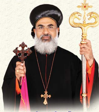
ആർച്ചുബിഷപ്പ് അഭിവന്ദ്യ തോമസ് മാർ കുറിലോസ് മെത്രാപ്പോലീത്താ (മാർച്ച് 18)