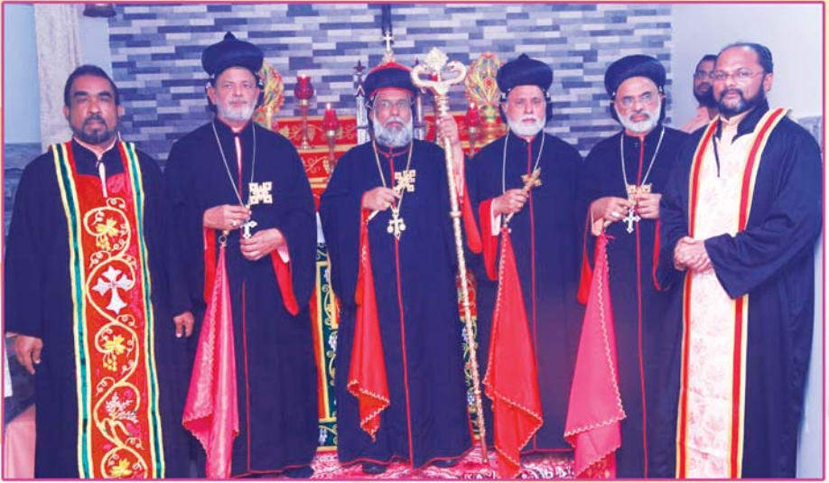
ശോബ്ദി സ്മാരക 'ദീപഗിരി' ബഥനി ആശ്രമത്തിന്റെ കുദാശ അത്യദിവന്യ കാതോലിക്കബാവാ തിരുമേനി നിർവ്വഹിക്കുന്നു. (റാന്നി-പെരുനാട്, 22 സെപ്റ്റംബർ 2018)