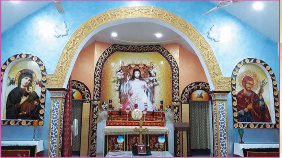
അത്യഭിവന്ദ്യ കാതോലിക്കബവാ തിരുമേനി കുമാരചെയ്ത കഴക്കൂന്നം സെന്റ് സെബാസ്റ്റ്യൻസ് വൈവാലയം (2 സെപ്റ്റംബർ 2018)