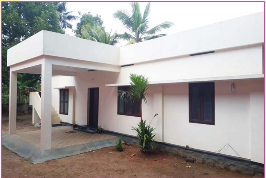
അത്യദിവന്യ കാതോലിക്കബാവാ തിരുമേനി കുദാശചെയ്ത വേങ്ങോട് മലകര സുറിയാനി കത്തോലിക്കാ ഇടവകയുടെ വൈദിക മന്ദിരം (2018 സെപ്റ്റംബർ 29)