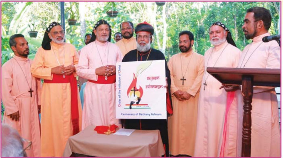
ബഥനിയുടെ ശൊബ്ദി ആഘോഷങ്ങൾ അത്യഭിവന്ദ്യ കാതോലിക്കബവാ തിരുമേനി ഉദ്ഘാടനം ചെയ്യുന്നു. (ദീപശിഥി, റാന്നി-പെരുനാട്, 22 സെപ്റ്റംബർ 2018)