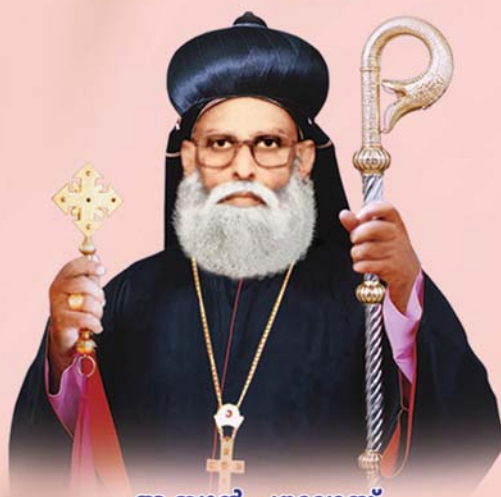
ആബുൻ പൗലോസ് മാർ പീലക്സിനോസ് മെത്രാപ്പോലീത്താ (നവംബർ 3)