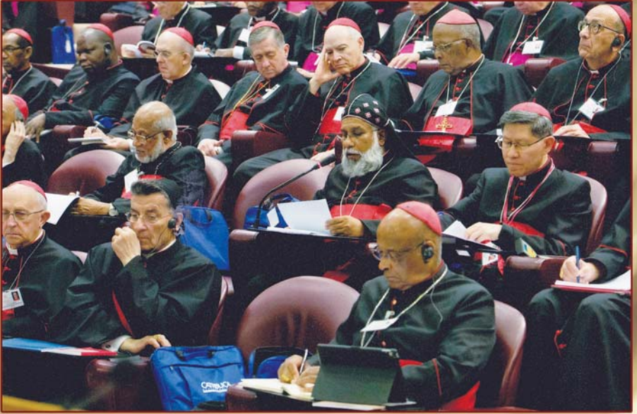
റോമിലെ സിനഡിൽ അത്യഭിവന്ദ്യ ബസേലിയോസ് ക്ലിമിസ് കാതോലിക്കാബവാ തിരുമേനി സംസാരിക്കുന്നു.