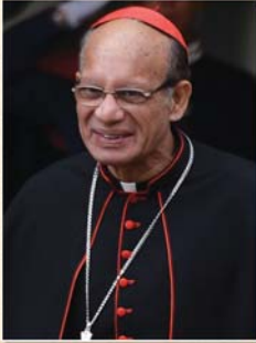
അത്യുന്നത കർദ്ദിനാൾ സെൻവാൾവ് ഗ്രേഷ്യസ് തിരുമേനി (പ്രസിഡന്റ്)