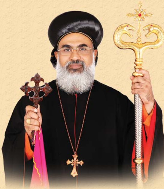
ആർച്ചുബിഷപ്പ് അഭിവന്ദ്യ തോമസ് മാർ കുറിലോസ് തിരുമേനി (മാർച്ച് 18)