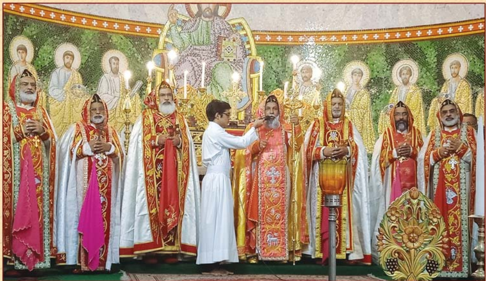
ഭോഗ്യസ്മരണാർഹനായ ആബുൻ ഗീവർഗ്ഗീസ് മാർ ദിവനാസിയോസ് തിരുമേനിയുടെ 41-ാം ഓർമ്മദിനത്തോടനുബന്ധിച്ച് നടന്ന വിശുദ്ധ കുർബാനയിൽ നിന്നും (സെന്റ് ജോൺസ് കത്തീഡ്രൽ തിരുവല്ല 2018 ഫെബ്രുവരി 26)