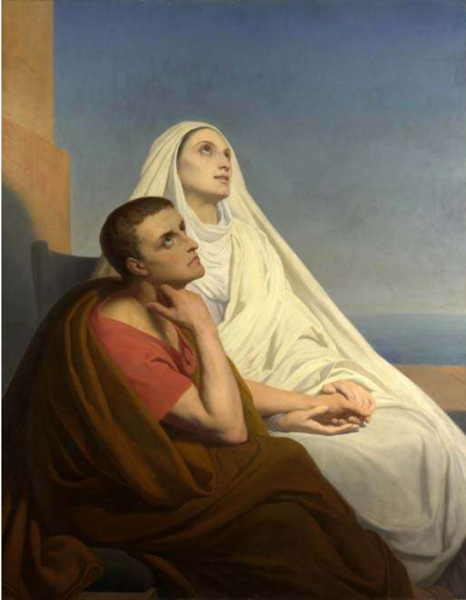
കരുതിയ റോമിലേക്ക് അദ്ധ്യാപനത്തിനായി എ.ഡി. 383-ൽ അഗസ്തീനോസ് യാത്ര തിരിച്ചു.