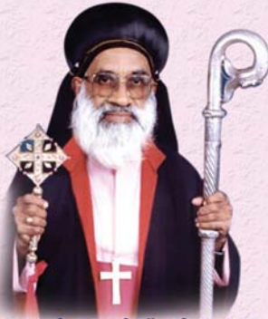
ആബുൻ ലോറൻസ് മാർ അപ്രേം (ഏപ്രിൽ 8)