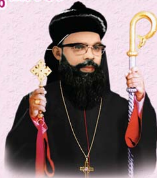
ആബുൻ ഐസക്ക് മാർ യൂഹാനോൻ (ഏപ്രിൽ 28)