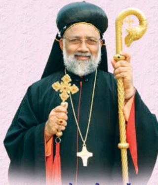
അഭിവന്ദ്യ എബ്രഹാം മാർ യൂലിയോസ് മെത്രാപ്പോലീത്താ (ഏപ്രിൽ 12)