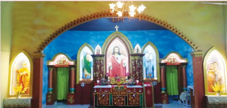
അത്യഭിവന്ദ്യ കാതോലിക്കാബാവാ തിരുമേനി കുദാശ ചെയ്ത സെന്റ് ജൂഡ് മലങ്കര സുറിയാനി കത്തോലിക്കാ ദൈവാലയ മദ്ബഹ (കല്ലടിച്ചുവിള, 9 മാർച്ച് 2019)