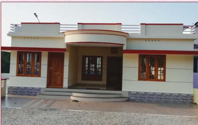
അത്യഭിവന്ദ്യ കാതോലിക്കാബാവാ തിരുമേനി കുദാശ ചെയ്ത വൈദിക മന്ദിരം (മഞ്ഞക്കാല, 2 മാർച്ച് 2019)