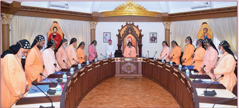
23-ാമത് പരി. എപ്പിസ്കോപ്പൽ സുന്നഹദോസ്സിൽ സംബന്ധിച്ച അഭിവന്ദ്യ പിതാക്കന്മാർ അത്യഭിവന്ദ്യ കാതോലിക്കാബാവാ തിരുമേനിയോടൊപ്പം. (11 മാർച്ച് 2019)